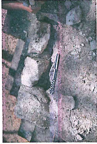
Foto 7. Limpieza y resane de grietas, Edificio 1, Grupo Maler, Yaxha