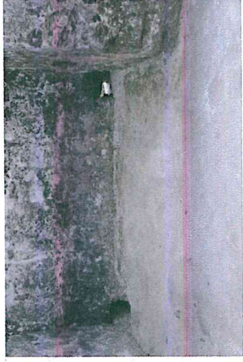
Foto 3. Cavidades para drenaje despejadas, cámara oeste, Edificio 216, Acrópolis Este, Yaxha

2. En la Acrópolis Norte se efectuaron trabajos de limpieza de maleza y barrido de basura orgánica en los edificios 134, 142, 144, 145 y 147 así como en el Basamento Oeste. De modo adicional, en el Edificio 142 se reintegraron bloques recién desprendidos. En total se alcanzaron 14408 m 2 .