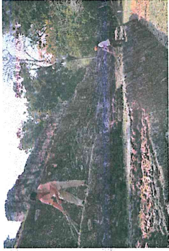
Foto 3. Barrido en el Basamento Oeste, Acrópolis Norte, Yaxha

3. En la Acrópolis sur se realizaron trabajos de conservación a los muros con estuco mediante la aplicación de agua de cal. Asimismo, las áreas que presentaban maleza en el Edificio 375 fueron atendidas. En total se abarcaron 2336 m 2 .