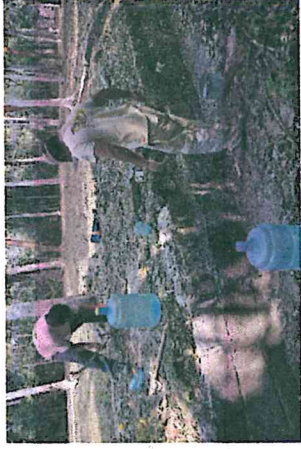
Foto 6. Proceso de reintegro de bloques desprendidos, parapeto Oeste, Calzada Blom, Yaxha