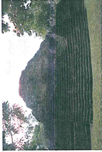
Foto 11. Edificio 152, Plaza C, Yaxha