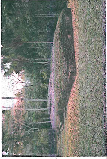
Foto 10. Edificio 160, Plaza A, Yaxha