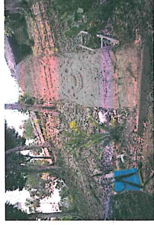
Foto 13. Réplica de la Estela 11 Yaxha

11. Se llevó a cabo la limpieza mecánica y húmeda de 19 estelas y 7 altares junto al mascarón, la maqueta y tres réplicas de Yaxha, removiendo hojas, tierra y microflora que surge y puede proliferar de no controlarse.