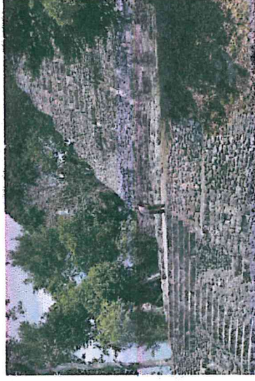
Foto 1. Trabajos en el Edificio 142, Acrópolis Norte, Yaxha

2. En la Acrópolis Norte se efectuaron trabajos de limpieza de maleza y barrido de basura orgánica en los edificios 134, 142, 144, 145 y 147 así como en el Basamento Oeste. De modo adicional, en el Edificio 142 se reintegraron bloques recién desprendidos. En total se alcanzaron 14408 m 2 .