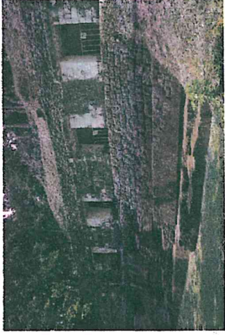
Foto 5. Edificio 389, Acrópolis Sur, Yaxha