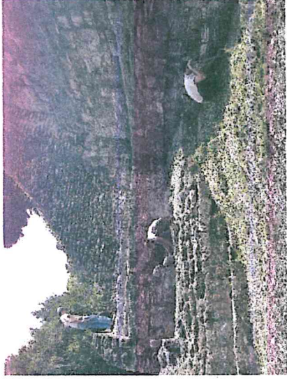
Foto 2. Limpieza de maleza y pisos en el Edificio 216, Acrópolis Este, Yaxha