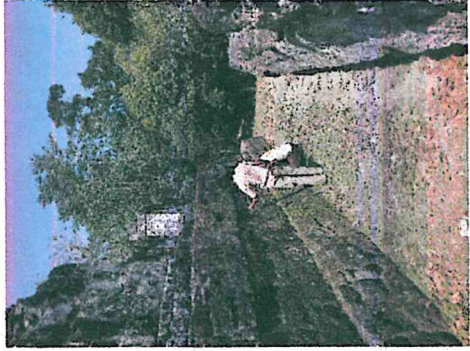
Foto 2. Limpieza de maleza, edificios 145 y 147, Acrópolis Norte, Yaxha