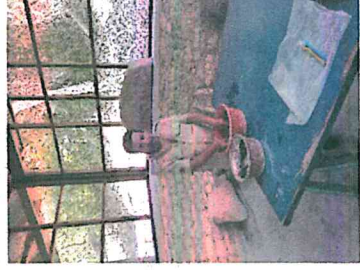
Foto 15. Proceso de lavado de los materiales recuperados en el Edificio 137 previo a su proceso de análisis

13. En el laboratorio de materiales arqueológicos del parque se ha proseguido con el lavado de los materiales cerámicos recuperados durante los trabajos de intervención en el Edificio 137 en coordinación con DECORSIAP.