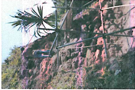
Foto 16. Sondeos en la esquina Sureste, segundo cuerpo, Edificio 137, Acrópolis Norte, Yaxha

14. En el Edificio 137 se ha proseguido con los sondeos en sus cuerpos superiores, encontrando diferencias marcadas entre la estratigrafía original y la capa de material agregado por la restauración. Del mismo modo se están realizando sondeos en la esquina Sureste a la altura del segundo cuerpo. Por parte de la administración se mantiene el apoyo para la realización de los trabajos coordinados con DECORSIAP, incluyendo insumos y el vehículo para el traslado de los materiales de trabajo.