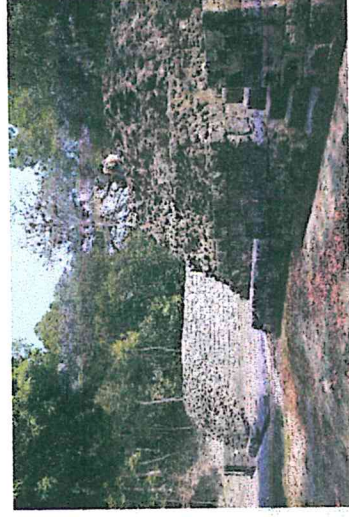
Foto 9. Juego de Pelota 1, Yaxha